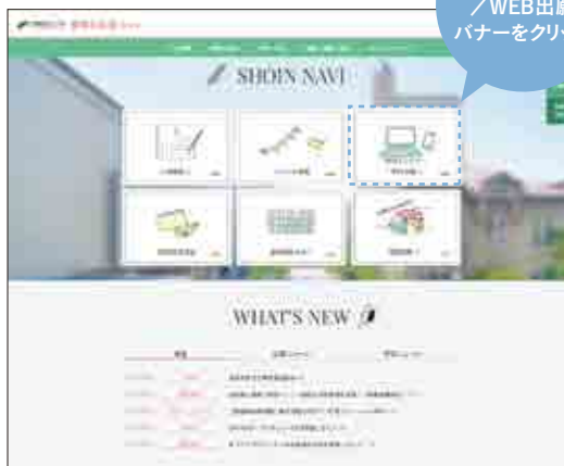
▲受験生応援サイト ※画面は昨年度のもので