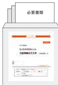
▲市販の角2封筒 市販の角2封筒に封筒貼付用宛名シートを貼り付けて必要書類を封入