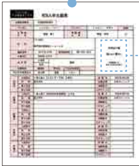
▲WEB入学志願票 (A4サイズで印刷) 顔写真を貼付 入試によって仕様(内容)が異なります