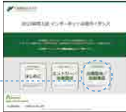
▲インターネット出願トップページ

入学検定料のお支払い後に届く「インターネット出願支払完了メール」記載のURL、もしくはインターネット出願トップページの「出願登録／出願確認」いずれかにアクセスしてWEB入学志願票、封筒貼付用宛名シートをダウンロードし、ページの拡大・縮小はせずにA4サイズで印刷してください。