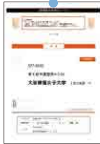
▲封筒貼付用宛名シート (A4サイズで印刷)