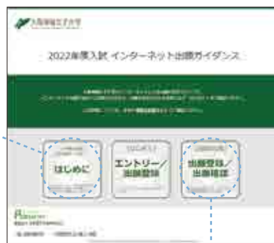
▲インターネット出願サイト

「はじめに」を必ずよく読んでいただいたうえで中央の「[はじめに]エントリー/出願登録」を選択してください。