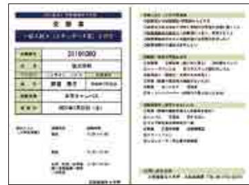
▲受験票 (A4で印刷してキリトリ) 入試によって仕様(内容)が異なります

入学検定料の入金、書類の受理が確認されると登録されたメールアドレスに送信される「出願完了メール」記載のURL、もしくはインターネット出願トップページの「[2回目以降]出願登録／出願確認」いずれかにアクセスし、受験票をダウンロードして印刷。受験票は必ず試験当日に持参してください。