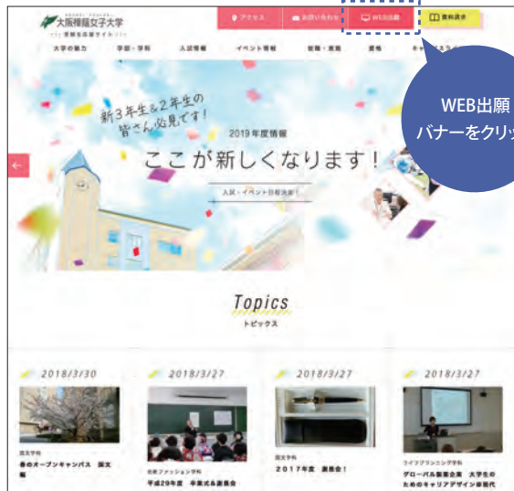
▲受験生応援サイト※画面は昨年度のものです

http://cheer.osaka-shoin.ac.jp/ にアクセスし、「インターネット出願」のバナーをクリック。