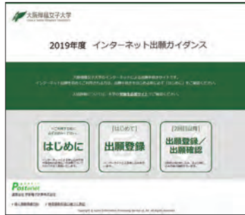
▲インターネット出願トップページ

入学検定料のお支払い後に届く「インターネット出願支払完了メール」記載のURL、もしくはインターネット出願トップページの「出願登録／出願確認」いずれかにアクセスしてWeb入学志願票、封筒貼付宛名シートをダウンロードし、ページの拡大・縮小はせずA4サイズで印刷してください。