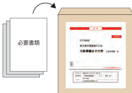
▲市販の角2封筒 市販の角2封筒に封筒貼付宛名シートを貼り付けて必要書類を封入

● 消印有効ではありません。出願登録期間最終日に本学に書類が到着するように、 簡易書留・速達 でお送りください。(締切日必着)