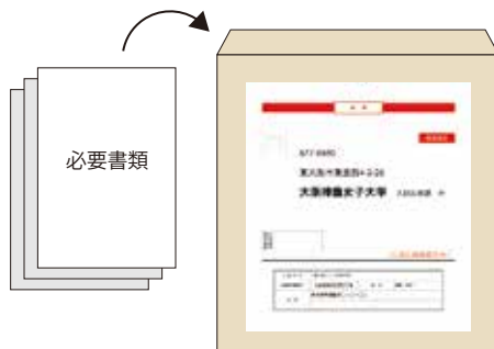
▲市販の角2用封筒 市販の角2封筒に封筒貼付用宛名シートを貼り付けて必要書類を封入