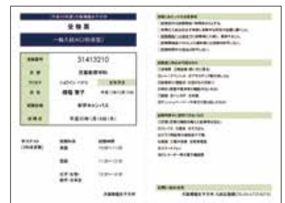
▲受験票 (A4で印刷してキリトリ)

受験票は必ず試験当日に持参してください。「一般入試AⅢ」「大学入試センター試験利用入試」の方も必ず印刷しておいてください。