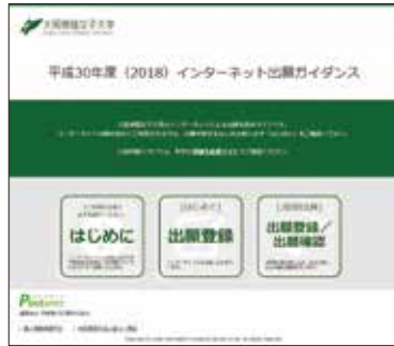
▲インターネット出願トップページ

入学検定料のお支払い後に届く「インターネット出願支払完了メール」記載のURL、もしくはインターネット出願トップページの「出願登録／出願確認」いずれかにアクセスしてWeb入学志願票、封筒貼付宛名シートをダウンロードし、ページの拡大・縮小はせずにA4サイズで印刷してください。