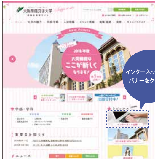
▲受験生応援サイト ※画面は昨年度のものです

http://cheer.osaka-shoin.ac.jp/ にアクセスし、「インターネット出願」のバナーをクリック。